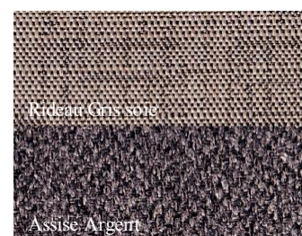
Rideau Gris soie